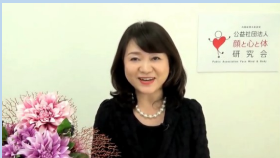
① メイクボランティア感染拡大防止ガイドラインについて(約 15 分)