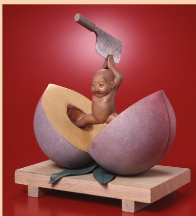
図2 「桃太郎白刃取り」