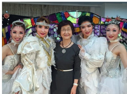
ベストライフ様の施設で公演を行った「演劇 集団呼華KOHANA」のメンバーと一緒に