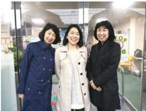
ベストライフ幕張にて

メイクボランティアに参加いただいた会員の皆様のお写真を、数枚ですがご紹介いたします。参加者皆様の笑顔の写真、ありがとうございます。