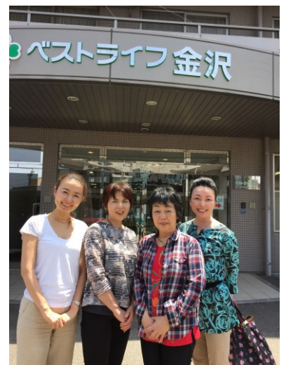
ベストライフ金沢にて