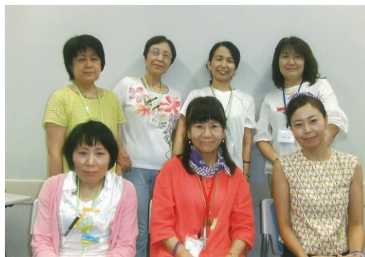
リレ・フォー・ライフ・ジャパンにいがた2017 (がん征圧イベント)にて